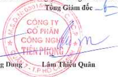
Lâm Thiệu Quân